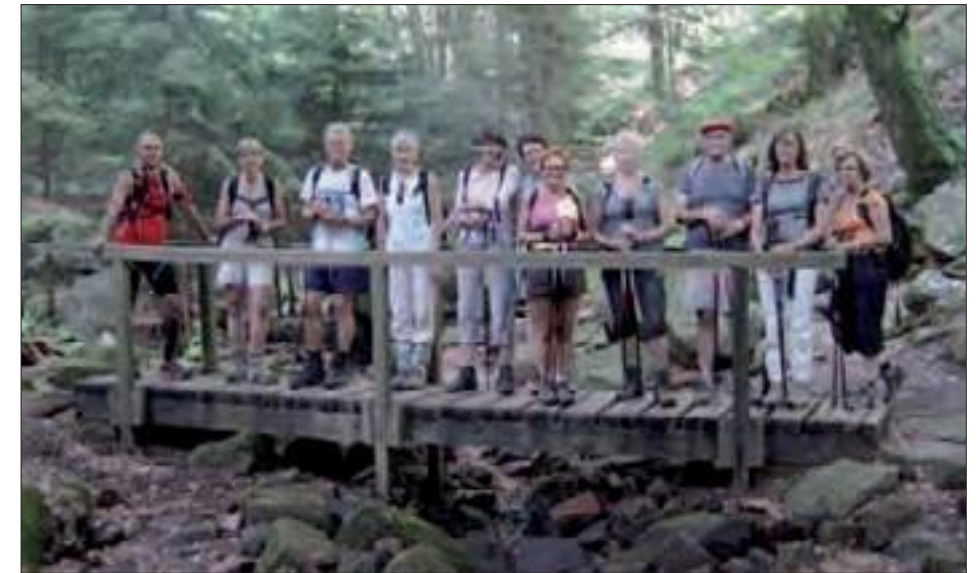
La randonnée et la marche sportive comptent de plus en plus d'adepte dans le Saulnois comme ailleurs. L'occasion de la pratiquer lors de Randosaulnois.