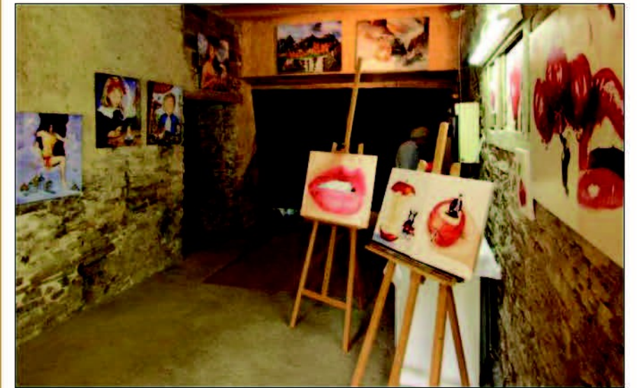
Les murs des granges serviront de cimaises aux artistes.