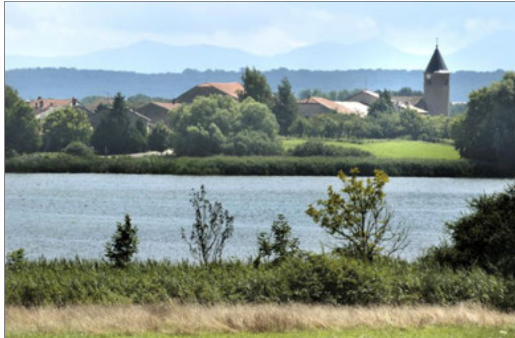
Sans véritable tête d'affiche parmi les candidats, la rurale 4 e circonscription de la Moselle s'annonce très disputée.