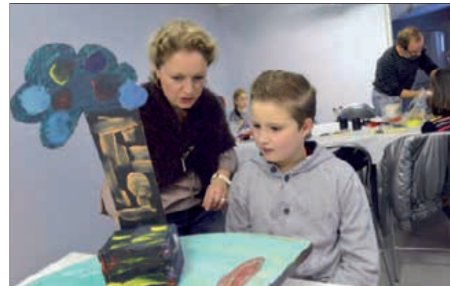
Les enfants ont travaillé à la confection des structures flottantes. Photo CG57.