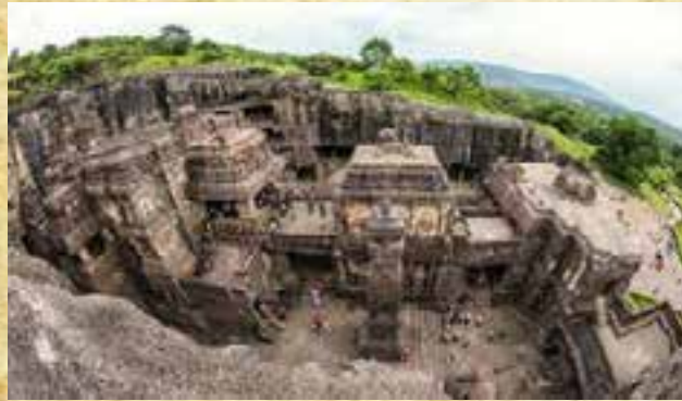
Temple de kailasa ou Kailâsamâtha à Ellora en Inde

A chaque numéro de votre journal, un article « top secret » vous sera proposé. A travers cette page, je vous ferai découvrir des choses extraordinaires, des lieux, des objets et des mystères qu'aucun scientifique, archéologue ou historien ne peut expliquer.